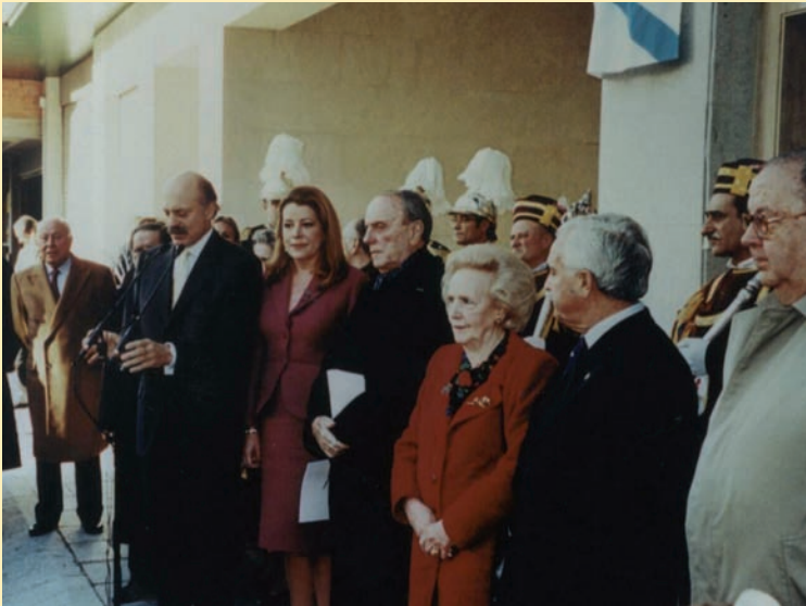
Plaza Eduardo Barreiros en Ourense (9-11-2000)